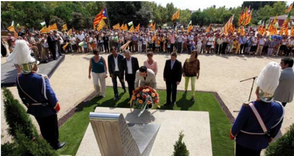
L'alcalde i els portaveus dels grups municipals van fer l'ofrena al monòlit de Lluís Companys

Diada. Entitats i institucions commemoren la Diada amb la tradicional ofrena floral al monòlit de Lluís Companys