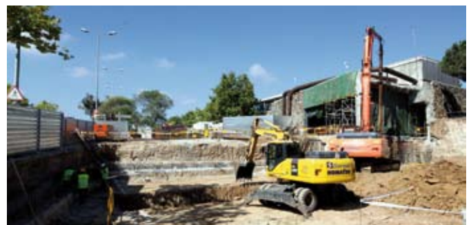
La central del parque de Catalunya se está ampliando

Las obras de ampliación de la central de recogida neumática costarán unos 10 millones de euros, cofinanzados en un 80% por la Comunidad Económica Europea dentro del programa "Una manera de hacer Europa" y un 20% de aportación municipal. ◀