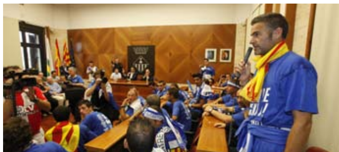
El Salón de Plenos se quedó pequeño para la recepción al equipo

Una vez en el balcón consistorial, llegó el momento de máxima emoción. Ante las 5.000 personas reunidas en la plaza de Sant Roc, los arlequinados agradecieron la dedicación y el apoyo de la ciudad y de los aficionados y recibieron múltiples muestras de cariño. Una gran fiesta que ilustra la gran alegría de todos por el ascenso. ◀