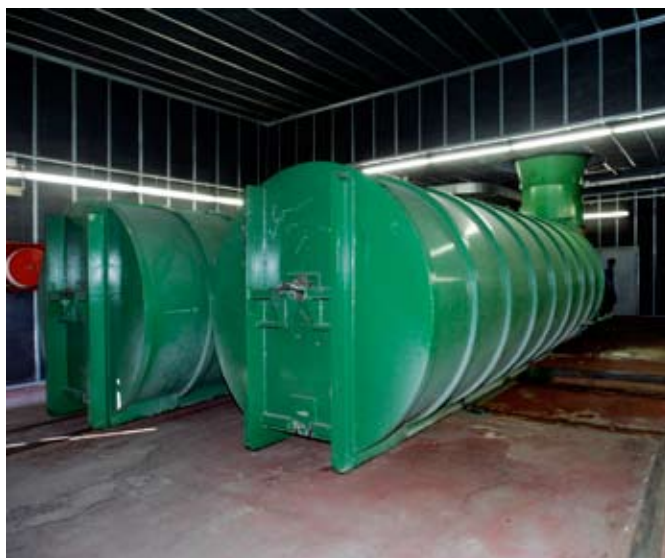
La central de recollida del parc de Catalunya passarà per un procés d'adequació

El nou sistema automatitzat recull les escombraries que es dipositen als contenidors separades per fraccions (envasos, matèria orgànica, paper i rebuig) i es transporten per