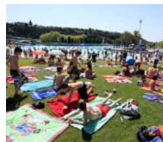
Cada año las piscinas municipales atraen a miles de bañistas

Más información sobre los cursillos y sobre el funcionamiento de las piscinas, en las oficinas de Sabadell Atenció Ciutadana o en el web municipal www.sabadell.cat . ◀