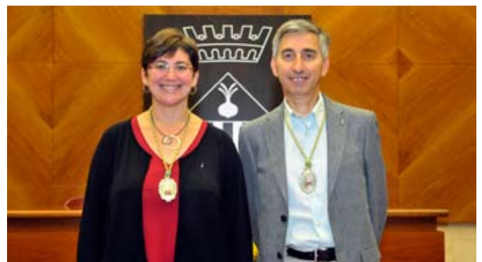
Grup Municipal d'ES