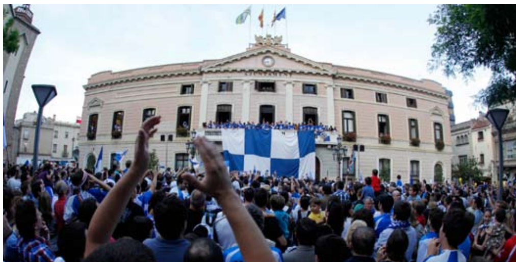
La plaza de Sant Roc se llenó para celebrar la vuelta a Segunda A tras 18 años

La celebración, que al igual que todos los partidos de la temporada se pudo seguir en directo por Ràdio Sabadell 94.6, empezó con un recorrido del equipo en autocar descubierto y decorado con los colores blanquiazules. Una ruta desde el Estadio de la Nova Creu Alta hasta el centro de la ciudad para compartir la alegría con toda la afición y que fue seguida por numerosos seguidores hasta culminar en el Ayuntamiento, donde aguardaban miles de aficionados y donde jugadores, cuerpo técnico y junta directiva fueron recibidos de forma oficial.