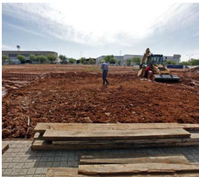
Las empresas del Centro podrán contar también si lo desean con asistencia técnica

Además, la instalación dispondrá de un vivero con 23 espacios para empresas de todo tipo y dos espacios de incubación destinados a nuevas propuestas empresariales.