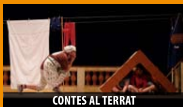
CONTES AL TERRAT