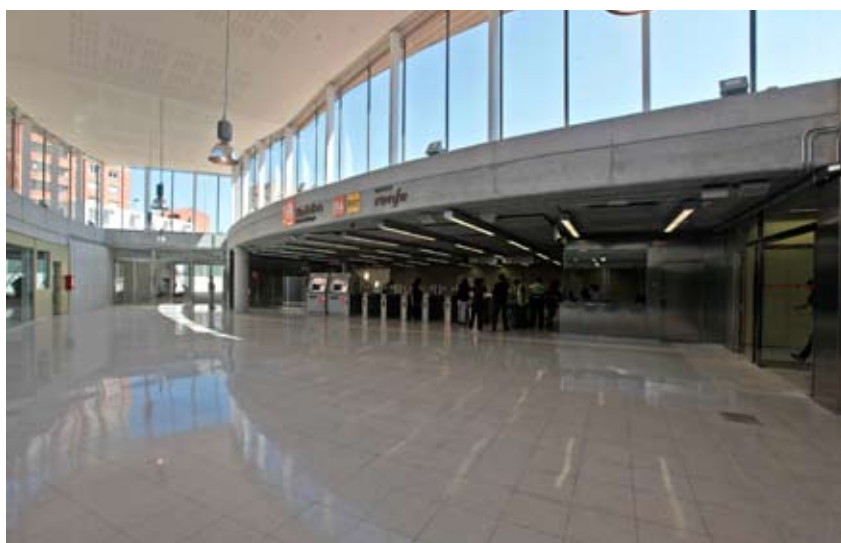
La nova estació de RENFE a la plaça d'Espanya enllaçarà amb Metro Sabadell

Transport públic. Després que la tuneladora que perfora el primer túnel arribés a la Creu Alta, la màquina ja avança cap al passeig de la plaça Major