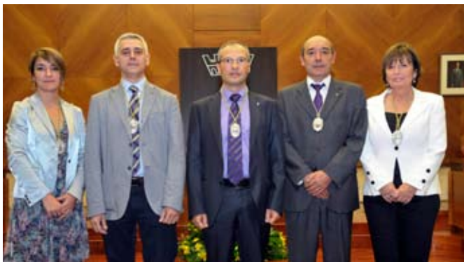
Grup Municipal de CiU