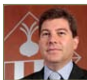
Josep Ayuso Portaveu del Govern