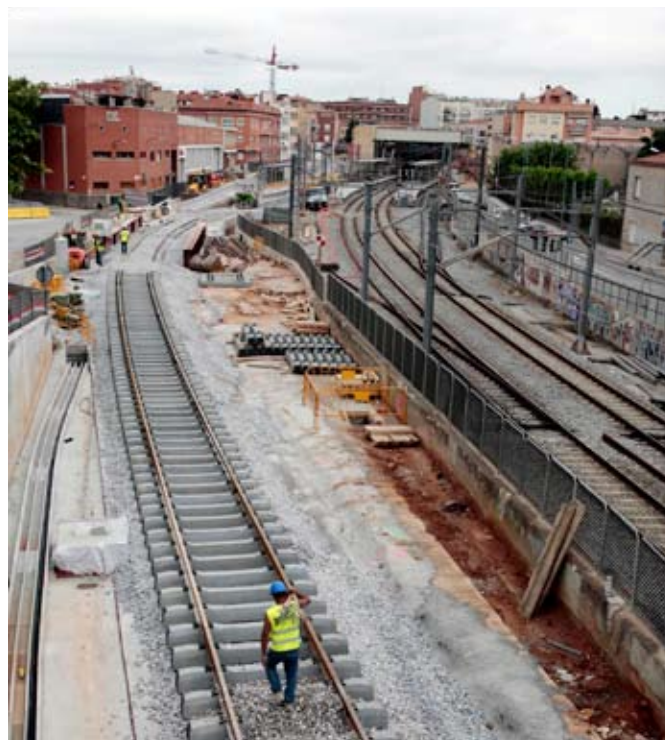
Obra de construcció de la via provisional a Gràcia - Can Feu

400 METRES és l'ampliació del soterrament de la línia a Gràcia i Can Feu