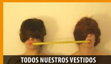
TODOS NUESTROS VESTIDOS