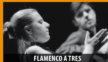
FLAMENCO A TRES