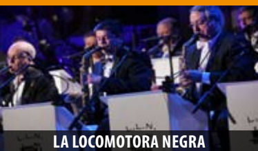
LA LOCOMOTORA NEGRA