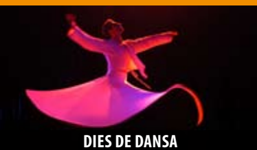
DIES DE DANSA