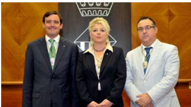
Grup Municipal del PP