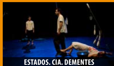
ESTADOS. CIA. DEMENTES