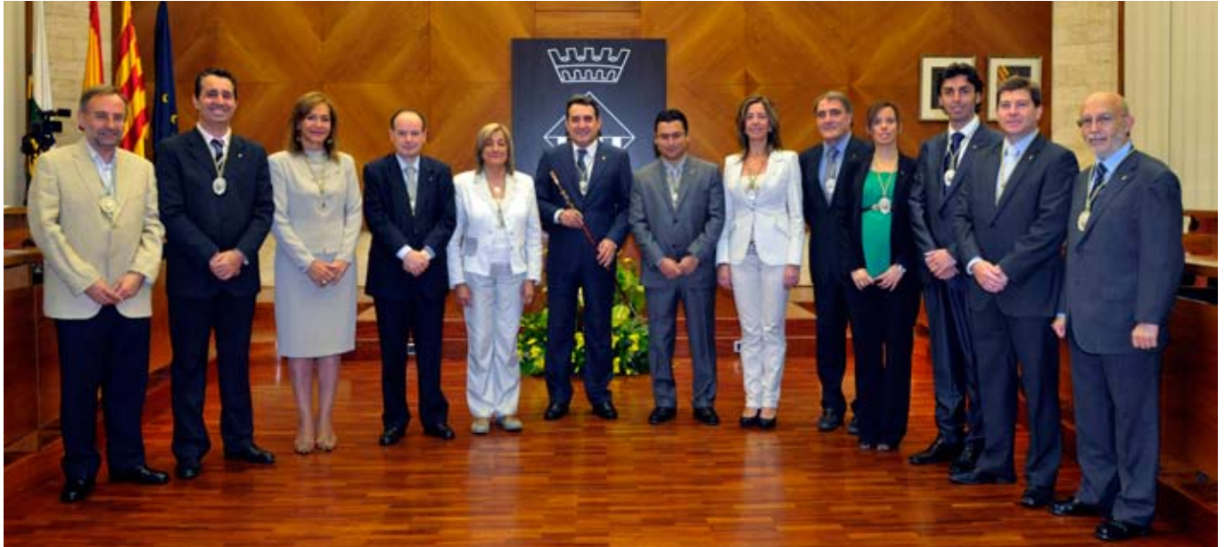
Grup Municipal del PSC