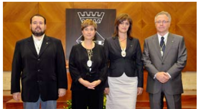
Grup Municipal d'ICV-EUiA