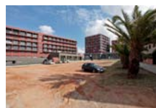
Aquest espai es transformarà en una plaça de més de 3.000 m 2

entre els carrers de Mostar i Zuric, l'avinguda d'Europa i el carrer de Praga. Serà la plaça de Granollers. El projecte preveu l'organització dels espais en funció dels usos i la mobilitat interna. Per aquesta raó, per exemple, s'ha procurat que a l'estiu s'utilitzi la zona més fresca de la plaça per ubicar-hi un berenador. ◀