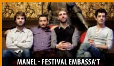
MANEL - FESTIVAL EMBASSA'T