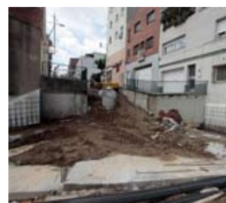
Una rampa salvarà el desnivell existent

Amb les obres, s'eliminaran les barreres arquitectòniques actuals i els veïnes i veïnes podran desplaçar-se amb més comoditat. Així mateix, els treballs s'aprofitaran per condicionar i soterrar les xarxes de telefonia i electricitat, alhora que es crearà un nou tram de xarxa de clavegueram i es millorarà l'enllumenat. ◀