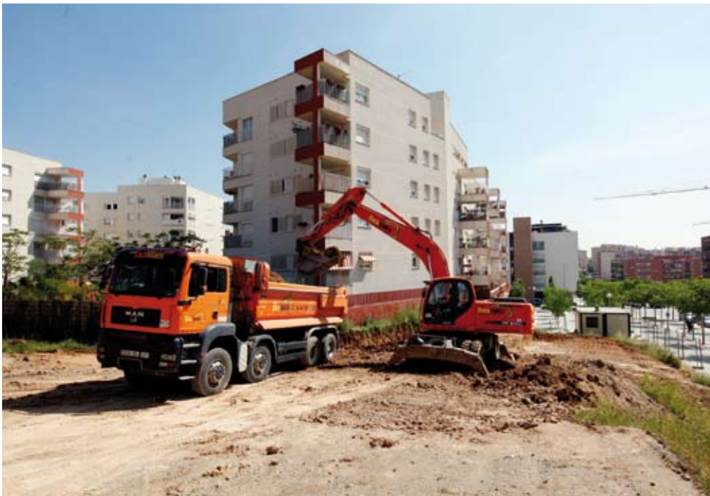
Las obras han empezado en el entorno de la masía de Can Llong

Obras. El futuro equipamiento costará 1,9 millones de euros y acogerá un auditorio, un gimnasio y salas polivalentes