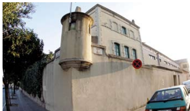
Caserna de la Guàrdia Civil

El Parc de Salut, impulsat per l'Ajuntament de Sabadell i la Fundació Parc Taulí el 2006, es va dissenyar per ser un referent en l'àmbit de la recerca científica i mèdica no només a Catalunya,