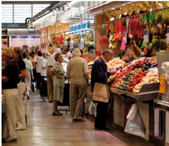
El Mercat Central es una de las lonjas donde se puede abrir el nuevo negocio

Los emprendedores han asistido a un curso de creación de empresas con el que recibieron