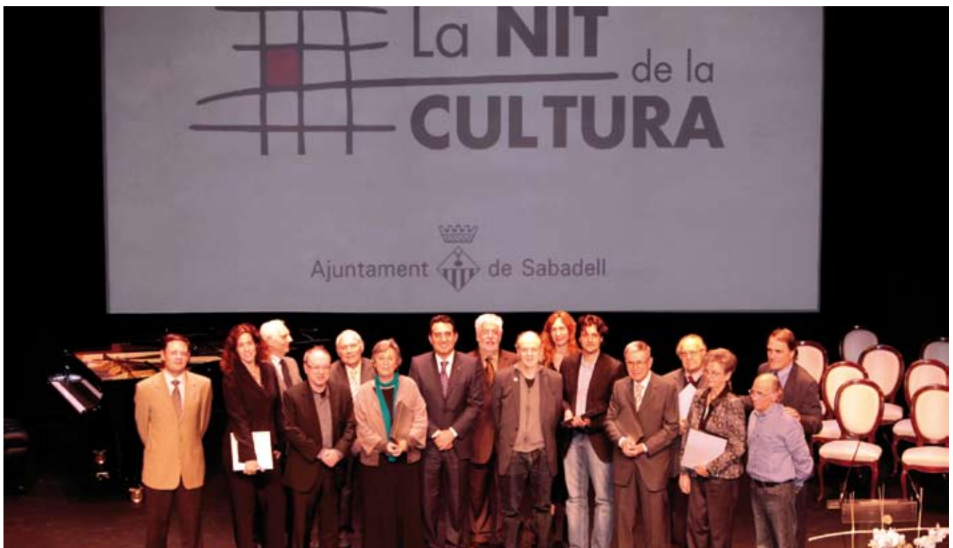
El Teatre Principal va acollir el lliurament de premis de la Nit de la Cultura en una emotiva cerimònia