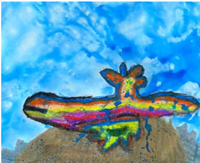
DIBUIX DE L'ESCOLA MIQUEL MARTÍ I POL