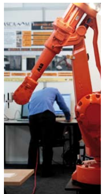
Un robot de la feria

En el marco del salón, se presentó un robot dotado del manipulador más rápido del mundo, equipos de desactivación de explosivos, limpiadores y robots auxiliares. La Feria Robotik ha servido para que profesionales y empresas del sector puedan ampliar su capacidad de negocio, de forma que la Feria se ha convertido en una nueva herramienta de impulso económico para el tejido empresarial. ◀