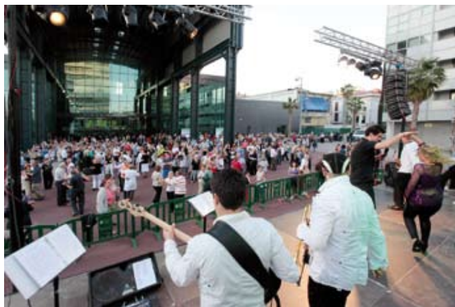
Un ball va tancar la Festa Gran

A Sabadell hi ha més de 35.000 persones de més de 65 anys, cosa que significa un 17% de la població. Es tracta, doncs, d'un col·lectiu molt important per atendre i donar-li serveis, a ells i a