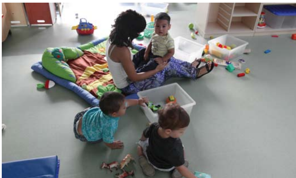
Es regulen els ajuts per a infants de les escoles bressol municipals el curs 2010-2011

Les característiques de la Casa Duran obliguen a limitar-ne