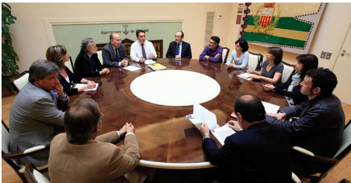
Reunió de l'alcalde amb els representants del Patronat del Parc de Salut

Inversions. Es reprendran converses amb el Govern central i la Generalitat perquè aquesta iniciativa sigui un referent en l'àmbit de la recerca científica i mèdica