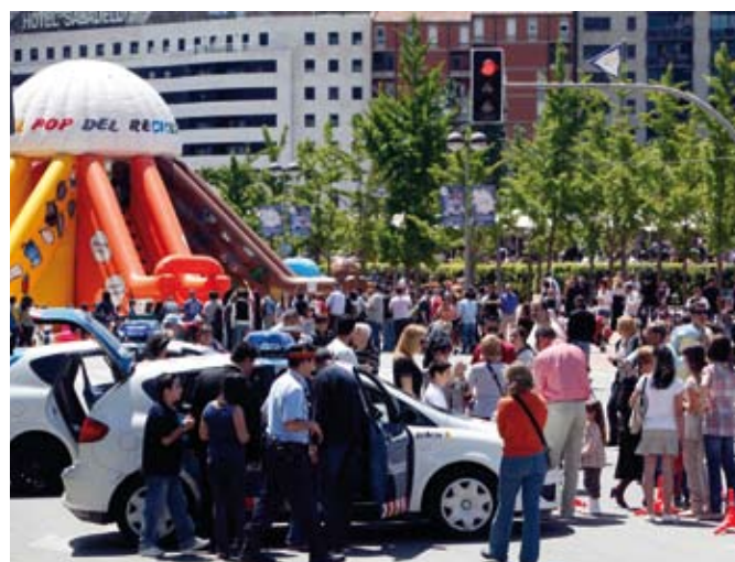
Les atraccions inflables van ser un èxit entre els infants

L'educació no va quedar al marge d'aquesta diada, ja que els més menuts van aprendre a reciclar amb el tobogan gegant del Punt del Reciclatge i la importància del compostatge amb un estand de sostenibilitat. Les activitats, organitzades per l'Ajuntament de Sabadell, van comptar amb la col·laboració de l'Agència de Residus, Medi Ambient i Reciclatge, Smat-sa, els cossos de seguretat i emergència, així com algunes AMPA, escoles i escoles bressol de la ciutat. ◀