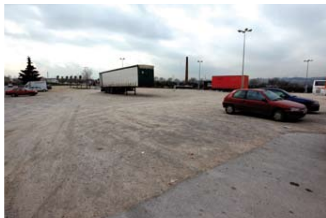
La residència es construirà en aquests terrenys

A cada planta superior, hi haurà un mòdul residencial de 30 llits, amb 24 dormitoris individuals i tres de dobles, i 7 usuaris de centre de dia. Cada planta residencial disposarà de servei de menjador propi. ◀