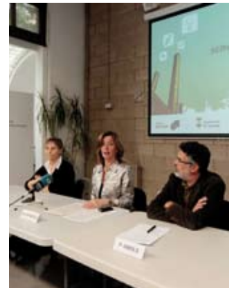
Presentación del nuevo servicio

El programa formativo finalizará con un curso de manipuladores de alimentos y una sesión informativa sobre las concesiones administrativas de las paradas de los mercados municipales y sus características: duración de la concesión, precio / canon, deberes y obligaciones y requisitos entre otros. ◀