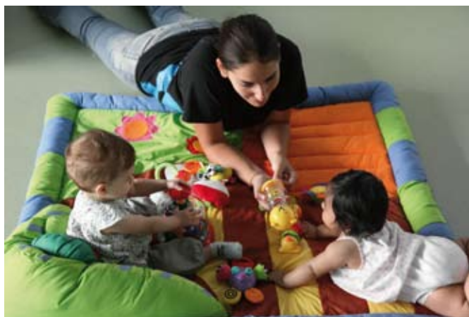
Les escoles bressol públiques atenen infants fins a 3 anys

Sabadell compta amb 12 escoles bressol públiques, de les quals 11 són municipals. Es tracta dels CEIF Andreu Castells, Arraona, Can Llong-Castellarnau, Can Puiggener, Creu Alta, el Vapor Buxeda Nou, Espronceda, Joaquim Blume i les EBM Calvet d'Estrella, Joan Montllor i La Romànica. A aquestes cal sumar-hi l'escola Els Àngels, de la Generalitat. A més de les places ordinàries, les escoles bressol municipals ofereixen els