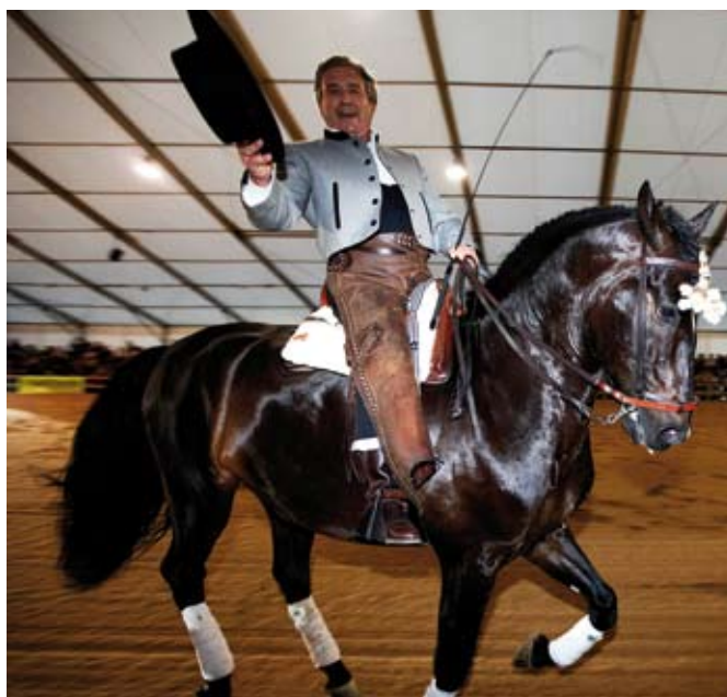
El cavall és el protagonista indiscutible d'aquesta fira

turisme eqüestre, organitzats amb la col·laboració del Consorci de Turisme del Vallès Occidental. Un any més, la Fira va ser una trobada sostenible amb la instal·lació de contenidors de recollida selectiva de residus, l'ús de vaixelles compostables o reutilitzables, la