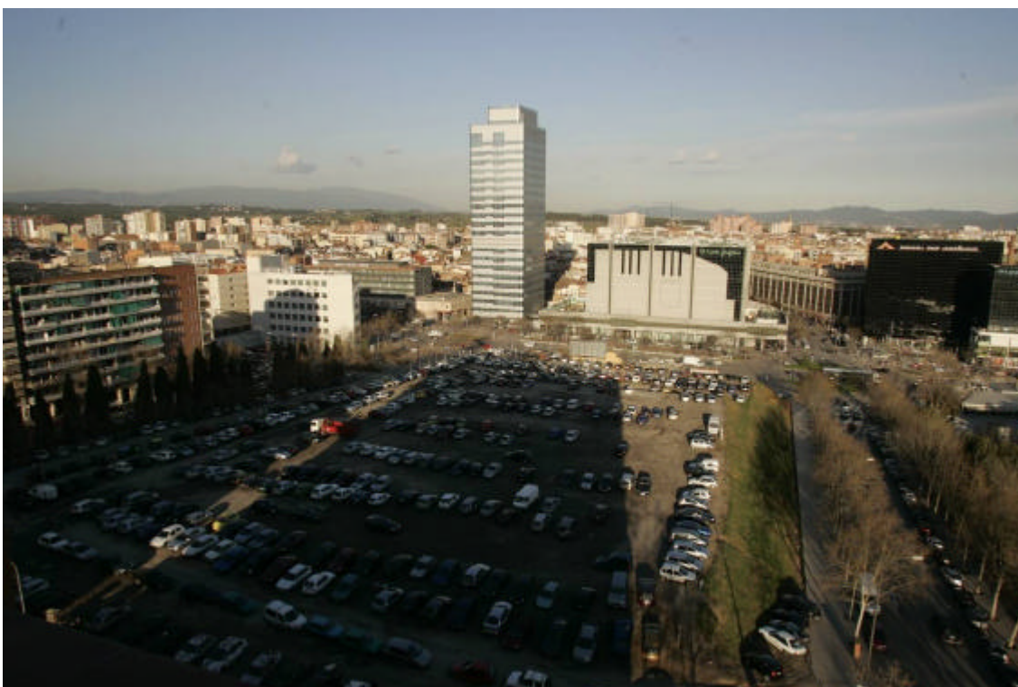
Vista del solar on s'ubicarà el projecte.

Actualment s'està treballant per unir tots els esforços possibles per fer realitat aquest equipament musical.