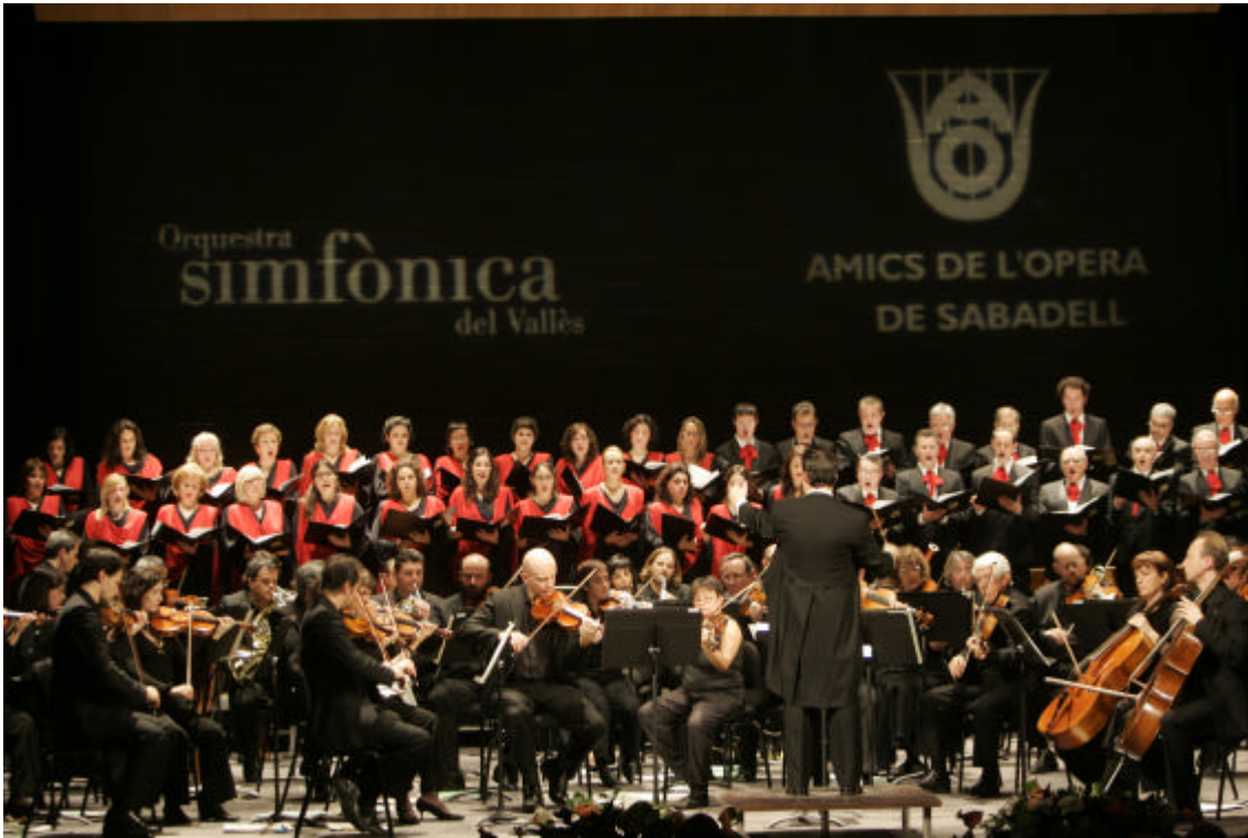
Concert del 25è aniversari dels Amics de l'Òpera i del 20è aniversari de l'Orquestra Simfònica.

Entre la Conselleria de Cultura de la Generalitat de Catalunya i l'AAOS es va endegar la idea de portar les òperes a altres poblacions. Així, el 1989 va néixer Òpera a Catalunya. El projecte servia per donar suport a la supervivència de l'Orquestra Simfònica del Vallès i difondre l'òpera i el repertori simfònic arreu del país. Per tant, un projecte del qual Catalunya n'era orfe ha donat, i està donant, uns resultats culturals més que positius, i ha fet despertar altres projectes musicals arreu del Principat. Així, milers de persones han descobert l'òpera i la música simfònica a través d'aquest projecte cultural.