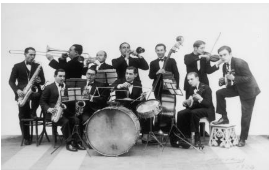
Orquestra Fatxendes, quan es forma l'orquestra moderna amb instruments de jazz. 1932.