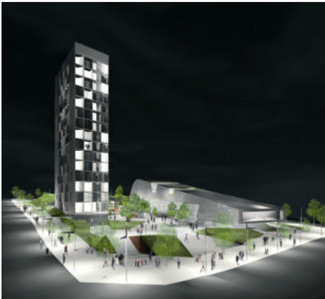
Projecte de Centre Cultural de l'Eix Macià.

S'han de preveure els espais per al personal que treballi a l'equipament (cantina, vestidors...).