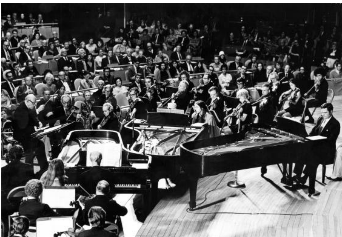
Pau Casals dirigint l'Orquestra del Festival Casals de Puerto Rico, el 24 d'octubre de 1971, durant el concert del Dia de les Nacions Unides, celebrat a l'Assemblea General de l'ONU a Nova York.

No és veritat que l'única referència vàlida per mesurar una pràctica artística com és la música sigui l'èxit o la taquilla.