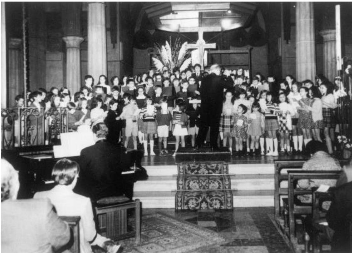
Orfeó Català. Concert als escolars de Sabadell de la Secció Nois i Noies. 1973.

entitat artística i musical de Sabadell identificada plenament amb els ideals que configuraven els primers grans orfeons de Catalunya.