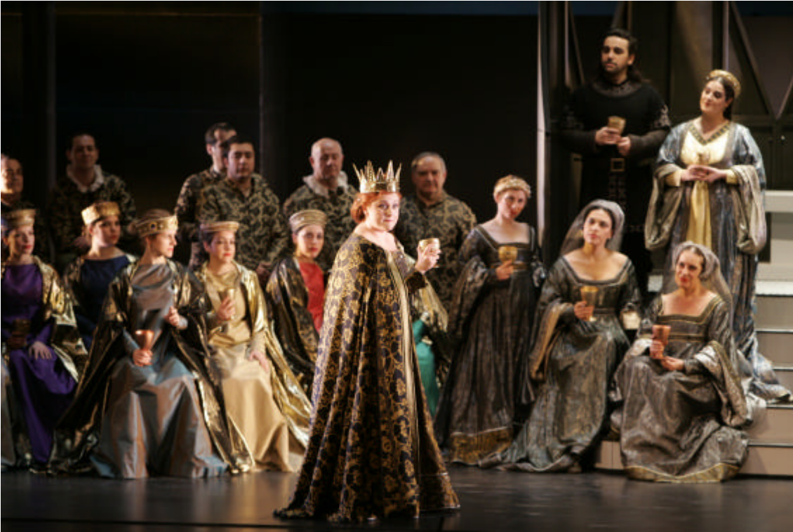
Representació de l'òpera Macbeth , al Teatre Municipal de la Farandula.