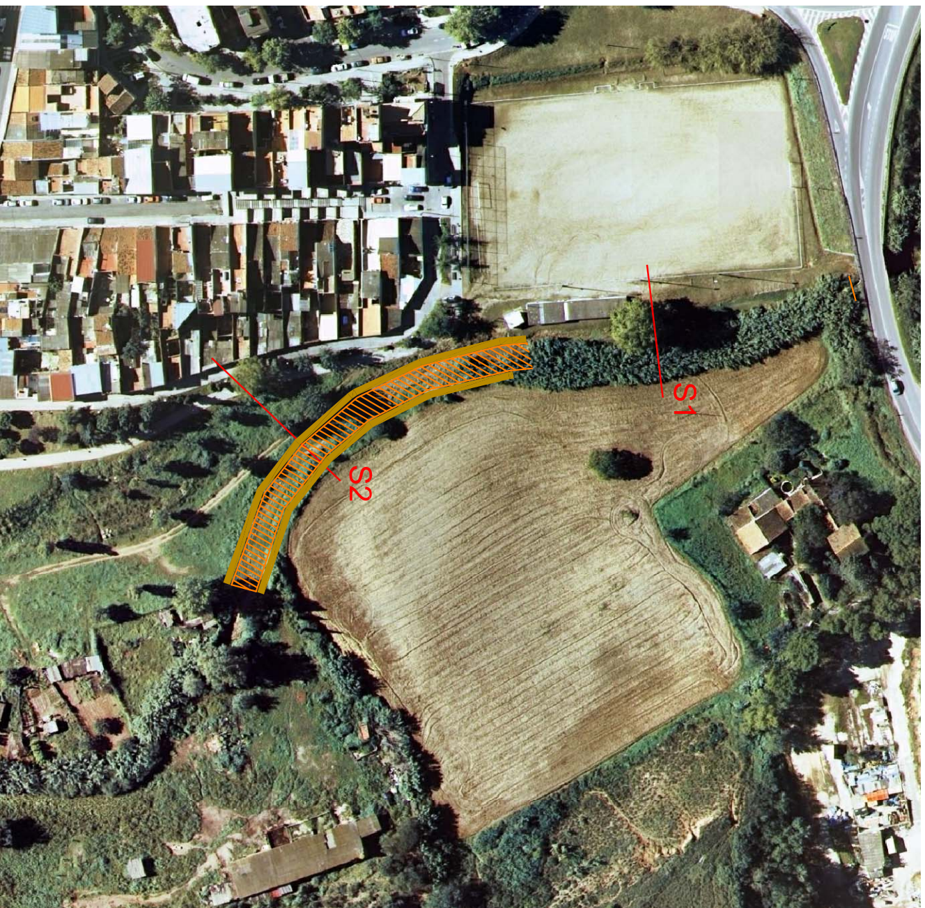
Talusos Zona excavada e 1:1500

La proposta consisteix en adoptar un seguit de mesures de contenció de la riera per a evitar les inundacions que es produeixen a l'alçada del camp de futbol, i en el meandre que es troba a continuació. La proposta tracia de rebaixar la base de la riera 1 metre per a delimitar el pas de l'alguia. Les terres sobrants es col·loquen en una mota per a evitar que sobresurti l'alguia durant les avingudes. D'aquesta manera es compensa el moviment de terres. Es distingeixen dos trams diferenciat. En un primer tram tenim una secció de 5 metres d'amplada i 2 metres de profunditat, ambdós talussos a 45 graus. El segon tram es diferencia per tenir 2.5 metres de profunditat, i un parell de motes de terra artificial a ambdues bandes del meandre. Les seccions s'han calculat amb base al període de recurrència de 10 anys, de manera que no hi hagi inundacions.